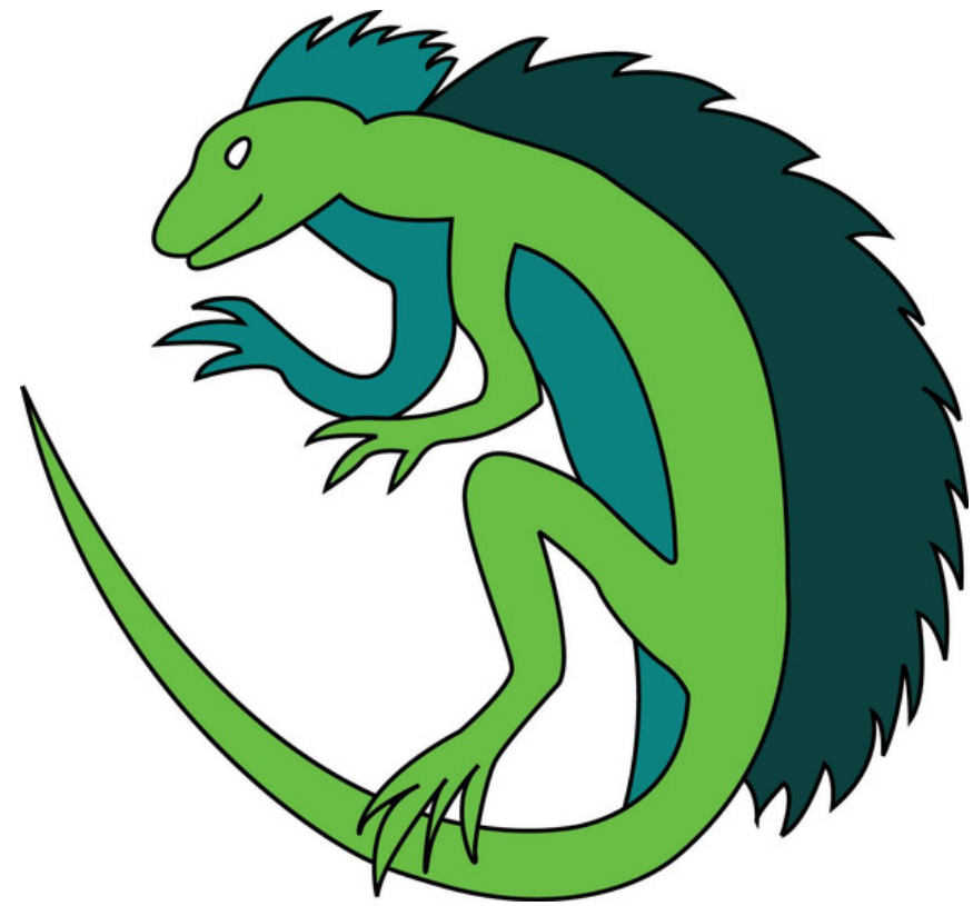
znak 2. oddílu Bazilišci

Jsme téměř šedesátičlenná parta skautů a skautek od těch nejmenších prcků předškolního věku až po zkušené vůdce. Na odsloužená léta ale nehledíme, všichni táhneme za jeden provaz. Protože ve více lidech se to lépe táhne - při dobrodružstvích i zábavě. Každý pátek mezi 16:00 a 20:00 se scházíme v klubovně v Domažlicích, o sobotách pořádáme různé výpravy a akce a v červenci vyrážíme na tábor do "Zapomenutého údolí" pod Čerchovem.