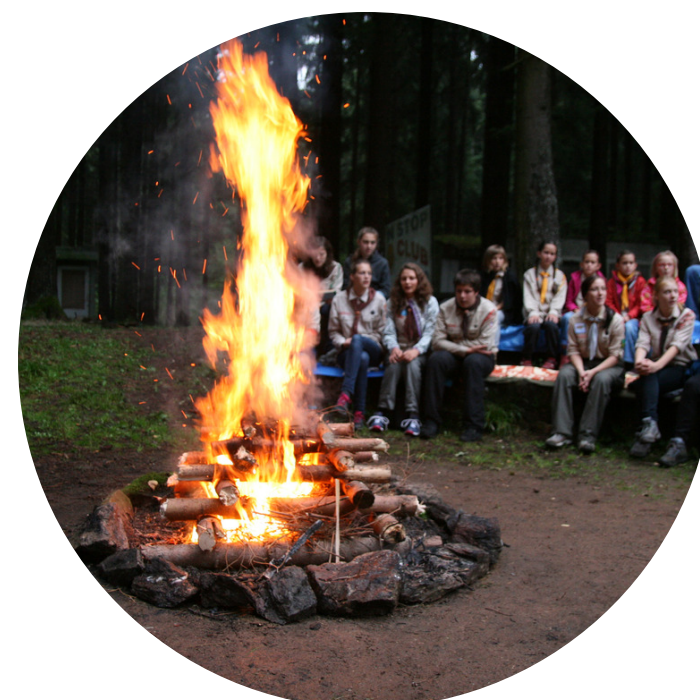
STŘEDISKOVÝ TÁBOROVÝ OHEŇ

V roce 2016 jsme zorganizovali spoustu povedených střediskových akcí a významně jsme se podíleli na organizaci řady akcí okresních. Navíc jsme spolupracovali i na organizaci krajského kola Závodu vlčat a světlušek v Horšovském Týně.