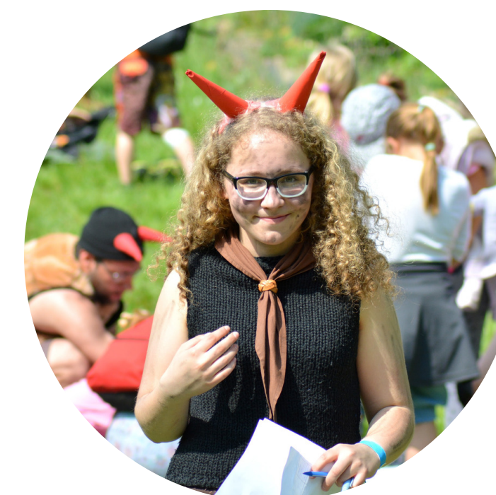
KRAJSKÉ KOLO ZÁVODU VLČAT A SVĚTLUŠEK V HORŠOVSKÉM TÝNĚ

Každý rok se na podzim pořádá pěvecká a zároveň i hudební soutěž. Děti si mohou jako celé družiny, jednotlivci anebo jako jiné a často různorodé skupiny připravit hudební vystoupení. Rok od roku bývají nápaditější a výjimkou ani není, když jsou doprovázena taneční choreografií nebo hereckým představením.